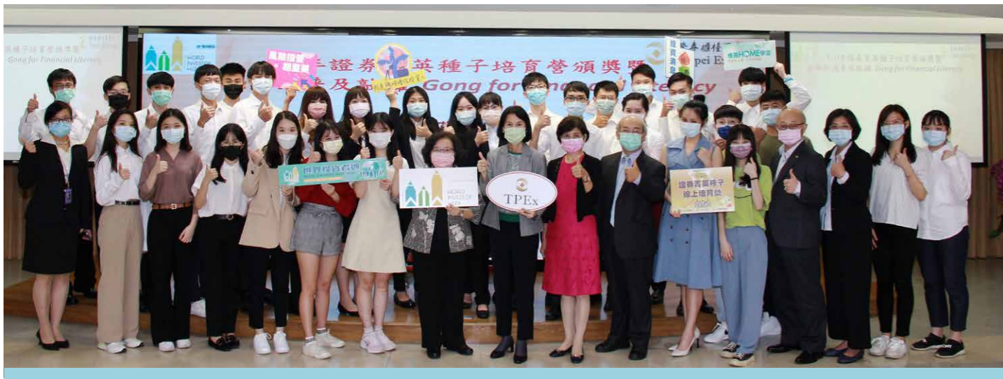
櫃買響應世界投資者週活動，金融知識普及敲鑼併同大專營競賽優勝頒獎典禮

2021年5月20日開始接受報名，計63所學校參與，共272隊956人報名，參賽隊伍是歷年最多的一次，最後共計59所學校，222隊789人完成線上課程學習及製作簡報影片參加投資組合競賽，10月6日辦理頒獎典禮後圓滿結束，並將研習課程影片及前3名同學隊伍簡報影片置放於櫃買中心官網，以擴大學習資源之利用，讓更多投資人有機會多方學習正確理財知識。