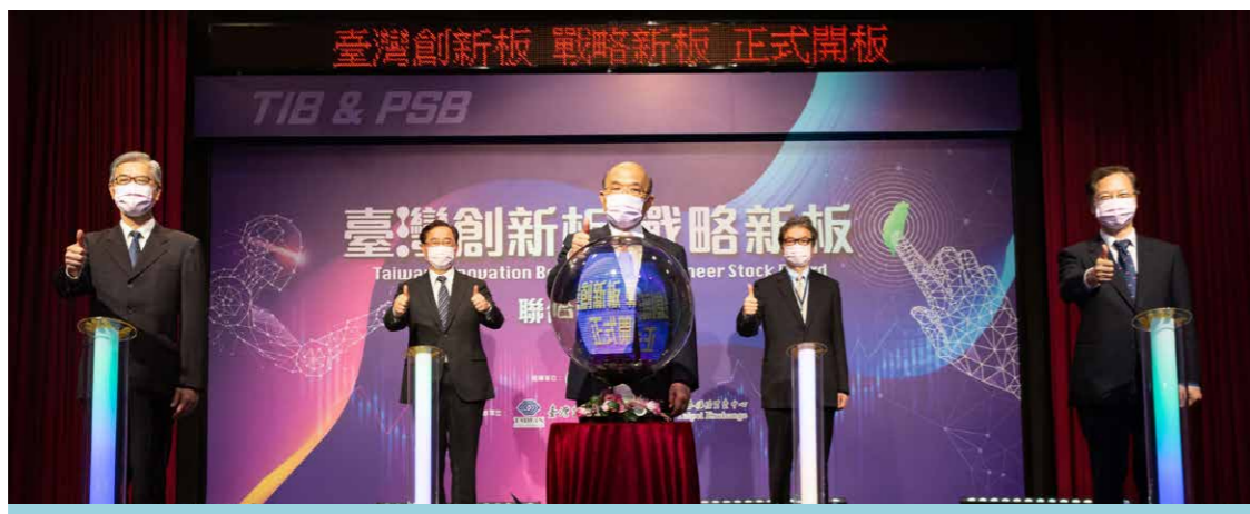
戰略新板開板典禮

資金是企業發展的活水，鏈結資本市場的動能對於準新創企業走向規模化發展更是關鍵的一步。2021年7月20日櫃買中心於興櫃市場下增設一掛牌機制更友善、交易方式更便捷的「戰略新板」(Pioneer Stock Board)。